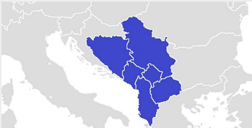
Zemlje Zapadnog Balkana

podršku kasnijem socio-ekonomskom oporavku, ali i paket od 750 milijuna eura makrofinancijske pomoći te 1,7 milijuna eura podrške Europske investicijske banke. 5 Ipak, kritičari ističu da je uspjeh samita i deklaracije djelomičan, jer ideja o periodičnom održavanju ovakvog samita svake tri godine nije zaživjela. 6 Isto tako u deklaraciji se izriekom ne spominje proširenje, što budi stanovitu skepsu u krajnji ishod čitavog procesa.