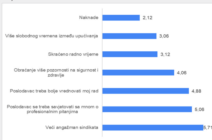
Slika 4. Prioriteti upućenih radnika kada su u pitanju uvjeti rada i zapošljavanja (1 – najvažnije, 7 – najmanje važno)

Što se tiče ostalih uvjeta rada i zapošljavanja, prihvatljivima ih smatra 40 % ispitanih radnika, 25 % se ne slaže, a 30 % ne zna. Većina navodi da im tvrtke ne omogućuju godišnje zdravstvene preglede (60 %) niti obuku o prevenciji rizika na radu i zaštiti zdravlja (65 %). Analiza potreba radnika i motivatora otkriva da su naknade te više slobodnog vremena između upućivanja glavni prioriteti, dok veći angažman sindikata i savjetovanje s poslodavcem o profesionalnim pitanjima radnici smatraju manje važnima (slika 4).