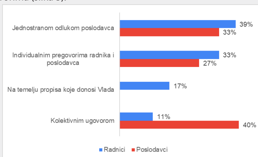
Slika 3. Određivanje naknada u sektoru prometa

Pitanja o uvjetima rada i zapošljavanja upućenih radnika u sektoru cestovnog prometa odnosila su se na tri specifična aspekta – sustav i koncepte nagrađivanja radnika na njihovom radnom mjestu, ostale uvjete rada, te na potrebe radnika glede uvjeta rada i stupnja osobnog zadovoljstva. Što se tiče uvjeta rada upućenih radnika, najviše radnika izjavilo je kako smatraju da se plaće određuju jednostranom odlukom poslodavca, dok se poslodavci s tim nisu složili navodeći da se plaće određuju kolektivnim ugovorima (slika 3).